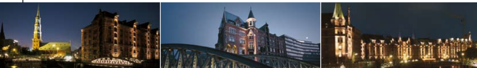
Illuminierte Speicherstadt - Elbe und Flut