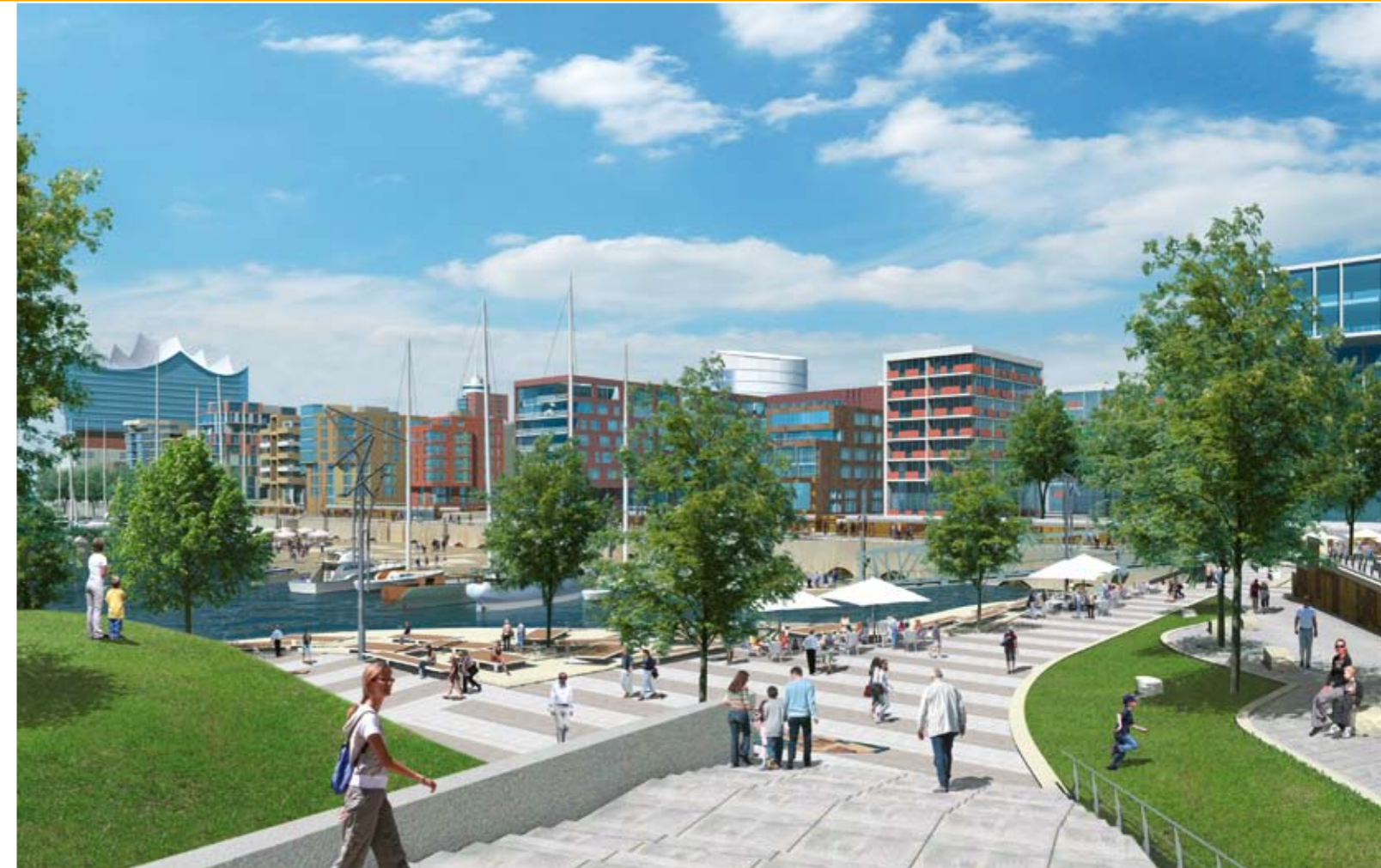
HafenCity-Animation: Andreas Schiebel, HafenCity Hamburg GmbH

Die HafenCity Hamburg GmbH (vormals GHS Gesellschaft für Hafen- und Standortentwicklung mbH) ist verantwortlich für das Entwicklungsmanagement und die Vermarktung der Grundstücke in der HafenCity. Sie ist eine 100%ige Tochter der Freien und Hansestadt Hamburg.